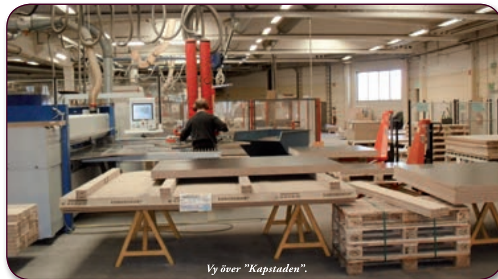
Vy över "Kapstaden".

DET VISADE SIG vara en lyckosam satsning och Direktlaminat har överlevt trots hård konkurrens. Ett stort avbräck inträffade när "Gudrun" drabbade Småland. Ingen elektricitet på en hel vecka och miljontals förlust som följd. Numera satsar Direktlaminat på tillverkning av möbel och inredningskomponenter med laminerade skivor som bas. Sammanlagt 42 personer arbetar idag med olika uppgifter i denna industri.