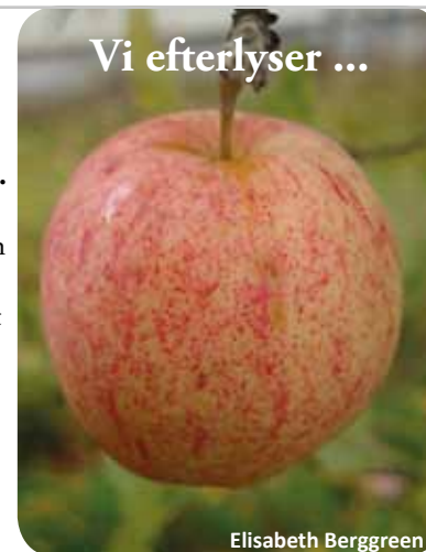
Vi efterlyser ...

Men vem vill väl ympa moderna äpplen, Aroma och Cox Orange kan vi köpa i affären. Det som är roligt att få tillbaka till trädgårdarna är de gammaldags äpplesorter som blivit sällsynta. I vår trädgård har vi kvar ett äppleträd som planterades 1918 när huset byggdes. Vackra äpplen med vitt nästan vaniljfärgat skall med rosa täckning, frukt-