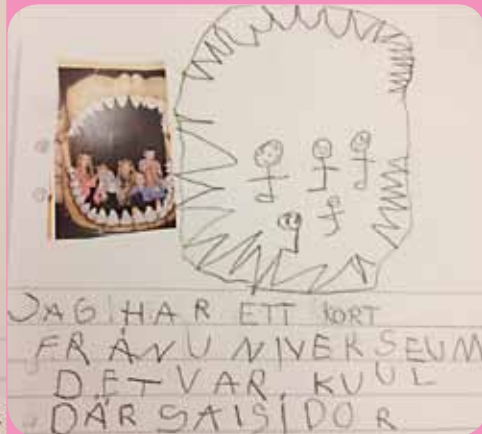
JAG HAR ETT JORT FRÅN U NIVERSEUM DET VAR KUL DÄR SA SIDOR